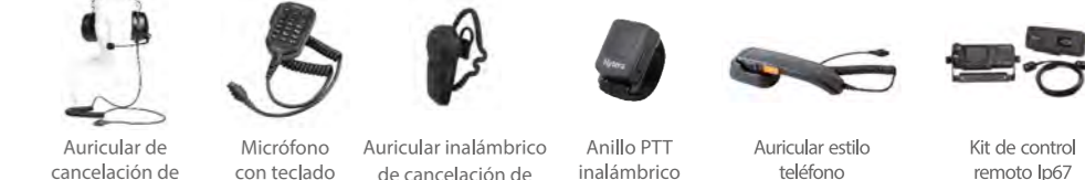
Auricular de cancelación de ruido de alta resistencia Micrófono con teclado Auricular inalámbrico de cancelación de ruido con PTT doble Anillo PTT inalámbrico Auricular estilo teléfono Kit de control remoto IP67

Las ilustraciones anteriores son solo de referencia y pueden diferir de los productos reales.