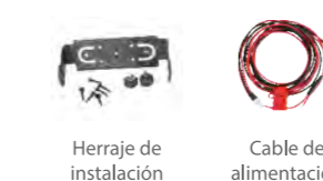
Herraje de instalación Cable de alimentación