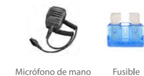
Micrófono de mano Fusible