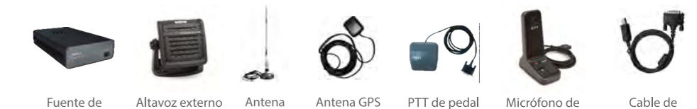
Fuente de alimentación externa Altavoz externo Antena Antena GPS PTT de pedal Micrófono de escritorio Cable de transmisión de datos